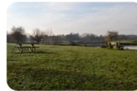
Plan d'eau de Grandchamp-des-Fontaines.

Longitude : 1° 36' 53,3" W Latitude : 47° 22' 42,4" N Altitude : 37 m